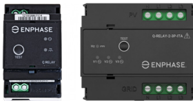
Q-Relay 1P en 3P

Sluit PV-modules snel en eenvoudig aan op IQ7 Series Microinverter met geïntegreerde MC4-connectoren.