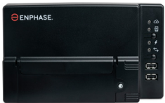
Enphase IQ Gateway

De krachtige, op het slimme net voorbereide, Enphase IQ7 Series Microinverters – IQ7, IQ7+ en IQ7A – vereenvoudigen het installatieproces aanzienlijk en bereiken tegelijkertijd de hoogste systeemprestaties.